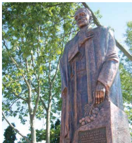
ЗВЕРНЕННЯ СІЛЬСЬКОГО ГОЛОВИ С. УГОРНИКІВ З ПРИВОДУ ВІДКРИТТЯ ПАМ'ЯТНИКА С. ЛЕНКАВСЬКОМУ

Закладення сільського скверу відбулося в районі перехрестя вулиць Федорченка, Черемхової та Повстанців, де й встановили монумент С. Ленкавському. Місце розташування скверу та ескізи пам'ятника були внесені на розгляд та погоджені в обласній художньо-архітектурній будівельній раді.